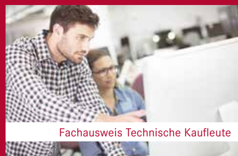
Fachausweis Technische Kaufleute