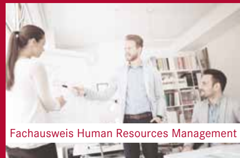
Fachausweis Human Resources Management