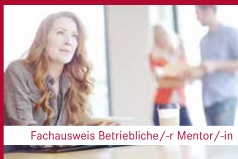
Fachausweis Betriebliche/-r Mentor/-in