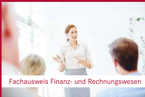
Fachausweis Finanz- und Rechnungswesen